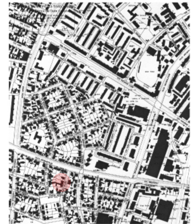
PLAN DE INCADRARE 1:5000

Regim de inaltime: - locuinta unifamiliala D+P